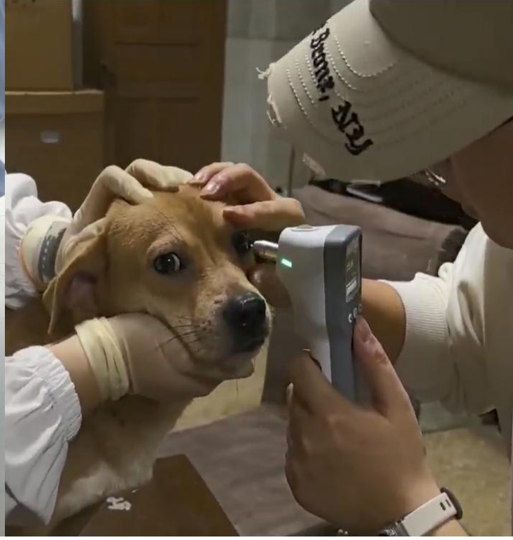
Evcil köpek üzerinde kullanım