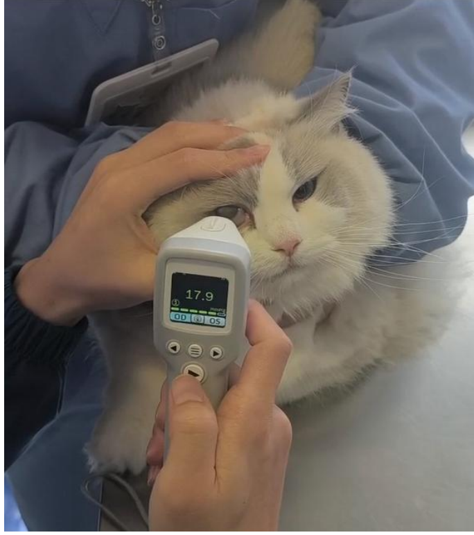
Evcil kedi üzerinde kullanım